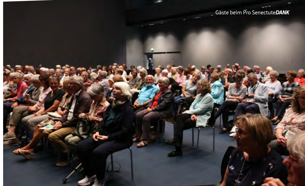
Gäste beim Pro Senectute DANK