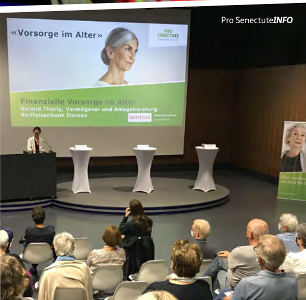
Pro Senectute INFO