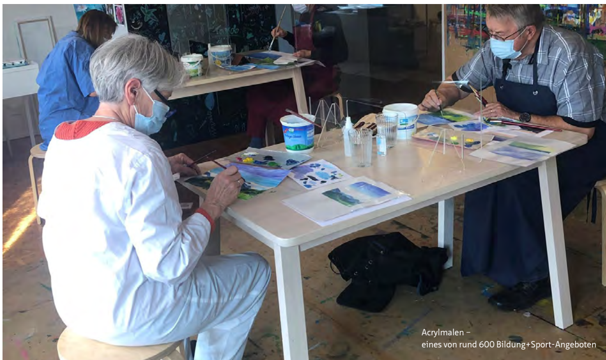
Acrylmalen – eines von rund 600 Bildung+Sport-Angeboten

boten individuelle Entlastung bei Begleitungen ins Spital, zu Arzt/Zahnarzt, Coiffeur, Einkaufen, beim Spazieren, Gesellschaft leisten und unterstützen beim Sortieren, Entsorgen, Umstellen, Waschen, Bügeln, Reinigen, bei Handwerklichen oder Gartenarbeiten und vielen weiteren Dienstleistungen.