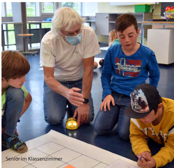
Seniör im Klassenzimmer

Rund 250 «Seniorinnen und Senioren im Klassenzimmer» (SiK) waren in zahlreichen Luzerner Gemeinden im Einsatz. Im Schuljahr 21/22 wurden sieben weitere Schuleinheiten Teil des Angebots SiK. Trotz der Pandemie gab es nur wenige Sistierungen der Einsätze. Das beliebte Generationenprojekt wird von der Kantonalen Dienststelle Volksschulbildung mitgetragen.